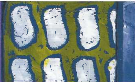
Claude Viallat, sans titre no 538 (détail), 2013, acrylique sur bâche bleue.