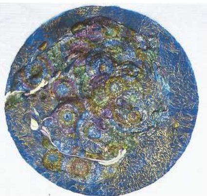
Virginie de Limbourg, Flower Field , 2013, aquarelle et acrylique sur papier.

ONIRIQUES, FLORALES, QUASI FANTASTIQUES, LES VARIATIONS picturales de Virginie de Limbourg nous emmènent en voyage dans des contrées magiques, hors du monde. Sous ses traits délicats, fluides et dansants, le papier devient le vecteur d'un imaginaire fertile et candide qui nous ouvre les portes de son monde mystérieux. Mais le spectateur n'est pas dupe, les histoires qu'elle nous raconte, bien qu'empreintes de leurs mystères, n'ont d'acidulé que les touches de rose bonbon qui les parsèment ici et là, et ses personnages imaginaires nous semblent plus tirés d'un conte de Tim Burton que de Perrault... On confine ici au seuil de l'étrange, dans des contours aux traits certes délicats mais témoignant néanmoins de cette spontanéité et d'une forme de compulsivité caractéristiques à l'art brut. Ici la couleur s'y conjugue à la matière, offrant au papier, support de prédilection de l'artiste, un volume subtil aux teintes mouvantes. Une œuvre qui prête à rêver.